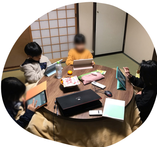
1階の和室 冬はこたつでまったり