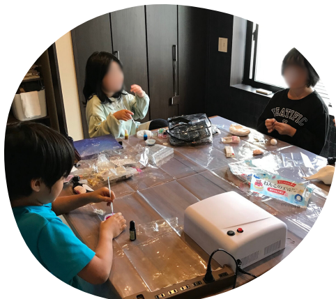
アートのじかん それぞれが好きなものを作るよ