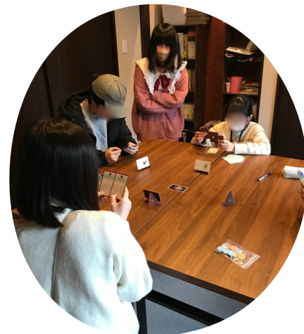
カードゲームのじかん