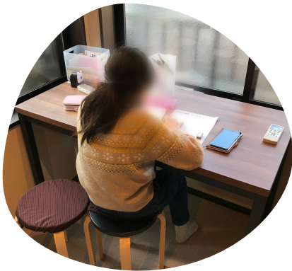
2階の学習室 集中してお勉強