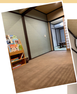
玄関を入った場所