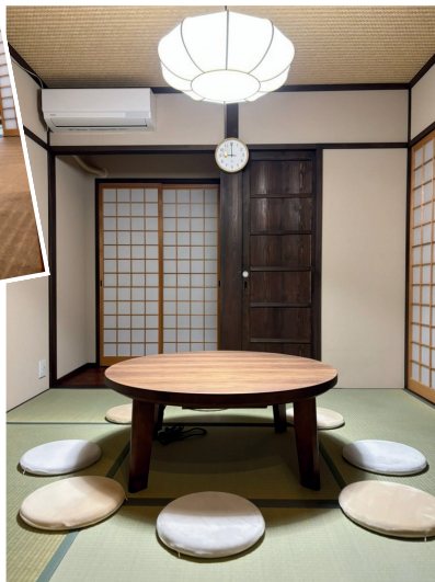
1階は和室。冬はこたつになるよ！ お話をしたり、料理をしたり、 ボードゲームをしたりするよ。