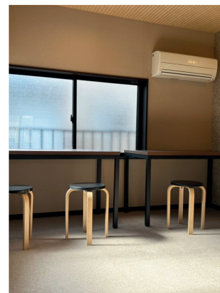
2階の学習の部屋。 サブの部屋としても使うよ。