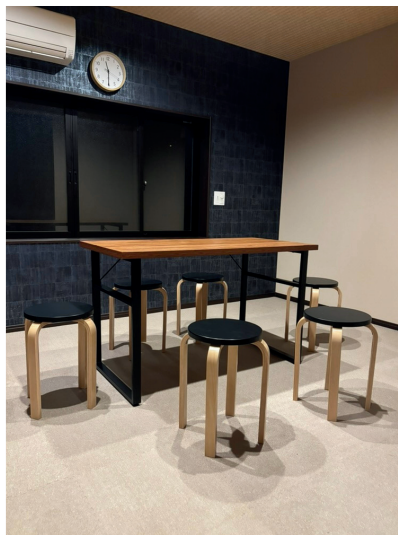
2階の部屋。 ものづくりをしたり、書道をしたり。 いろんな体験をするメインの場所だよ。